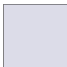
Produktplatzierung im Header

Gerne machen wir Ihnen ein individuelles Angebot für Ihre Online-Werbung auf unserer Webseite. Auf Wunsch auch kombiniert mit Social Media . Preise auf Anfrage nach Laufzeit und Platzierung.