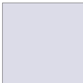
Werbebanner Quadrat in der Sidebar 400 x 400 px