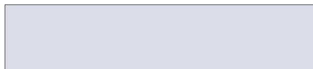
Werbebanner quer im Contentbereich 820 x 200 px

Preise gelten für eine Laufzeit von 14 Tagen.